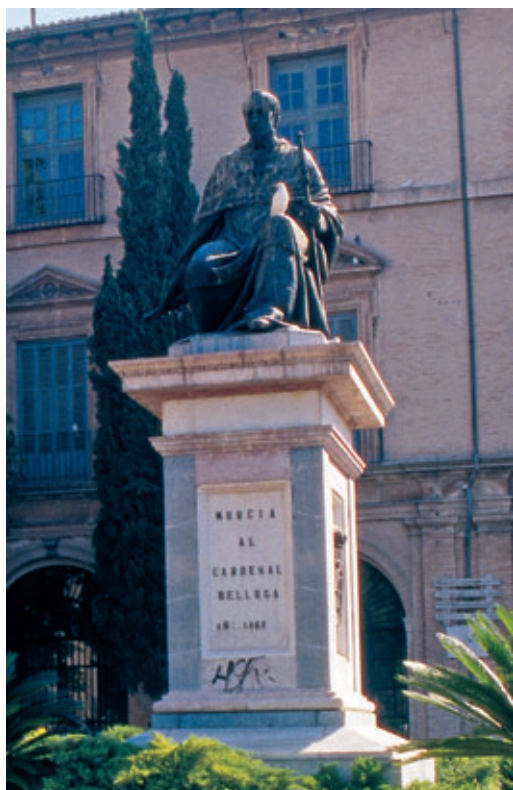
Luis Belluga fue un hombre clave en la resistencia murciana a los ataques ingleses durante la Guerra de Sucesión. Posteriormente, fue nombrado virrey y capitán general de Valencia y Murcia. En 1719 fue designado cardenal.